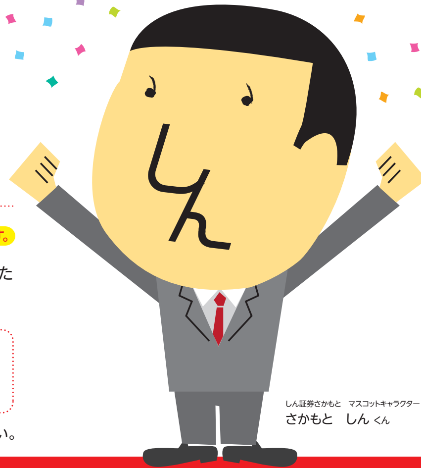
しん証券さかもと マスコットキャラクター さかもと しんくん